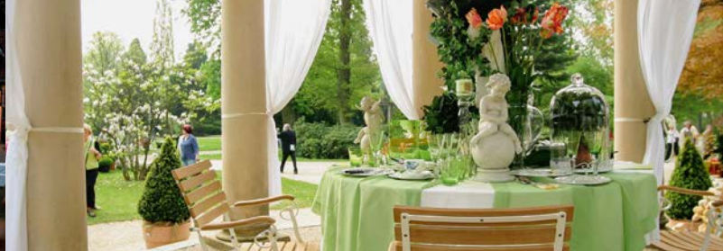
Erdbeertempel im Kurpark Bad Pyrmont