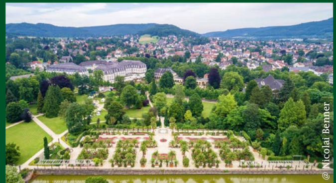
Kurpark Bad Pyrmont