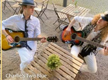
Charlie's Two Blue